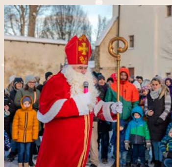
Besuch vom Nikolaus