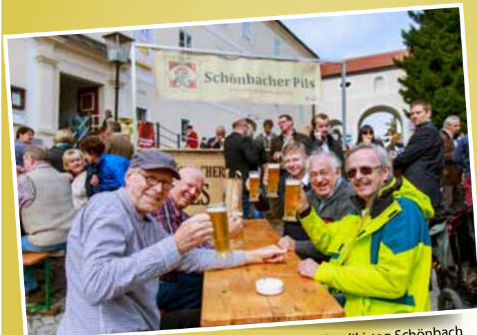
Beste Unterhaltung beim Kriecherl- und Michaelikirtag Schönbach

Als Dankeschön erhalten Sie eine kleine Flasche Kriecherlnektar und die Erwähnung im Kochbuch.