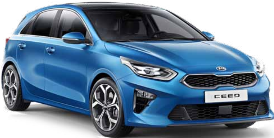
◆ Premiere des neuen KIA Ceed

29. und 30. September 2018 im Autohaus Böhm, 10 – 17 Uhr