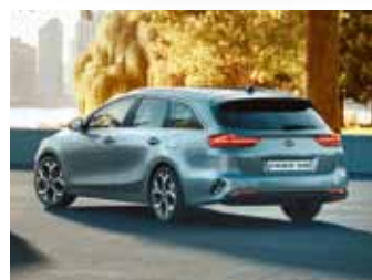
◆ Premiere des neuen KIA Ceed SW