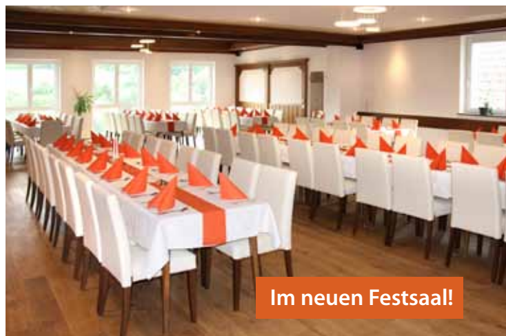
Im neuen Festsaal!