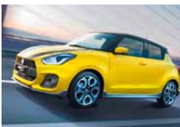
◆ Neuer Suzuki Swift Sport