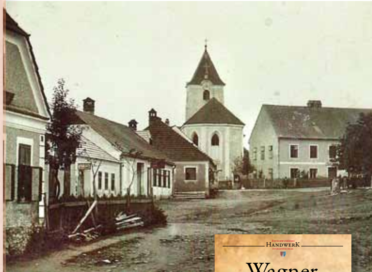
Der Marktplatz von Grafenschlag, ca. 1931

3613 Albrechtsberg 101 Tel.: 0676 87 83 4040 EMS-TRAINERIN, Herbalifeberater, Young Living Ölse, Orthobionomy (PA) BIO HANFPRODUKTE